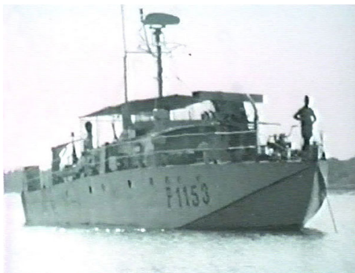
Guiné - A LFP «Procion»

Durante todo o período em que esteve operacional foram comandantes da LFP «Procion» os seguinte oficial dos Quadros Permanentes: